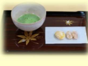
お茶会の抹茶とお菓子