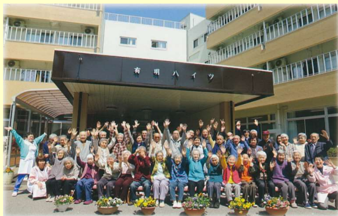
みんなで写真撮影