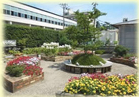
やすらぎの庭の花々たち