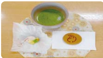
ホーム喫茶(抹茶セット)

「安全で心身ともに健やかな生活」をしていただけるように施設を利用される一人ひとりにあった心のこもったサービスを提供することを目指します。