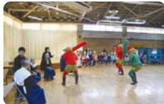
有明こども園との交流会