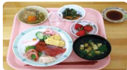
誕生会(ちらし寿司)