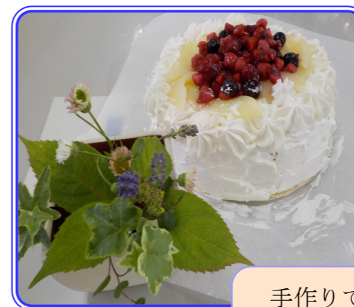
手作りで美味しそう！