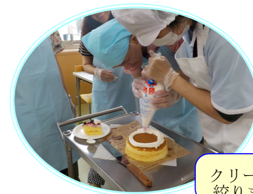
クリームを絞ります！