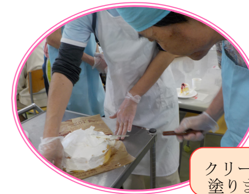
クリームを塗ります！